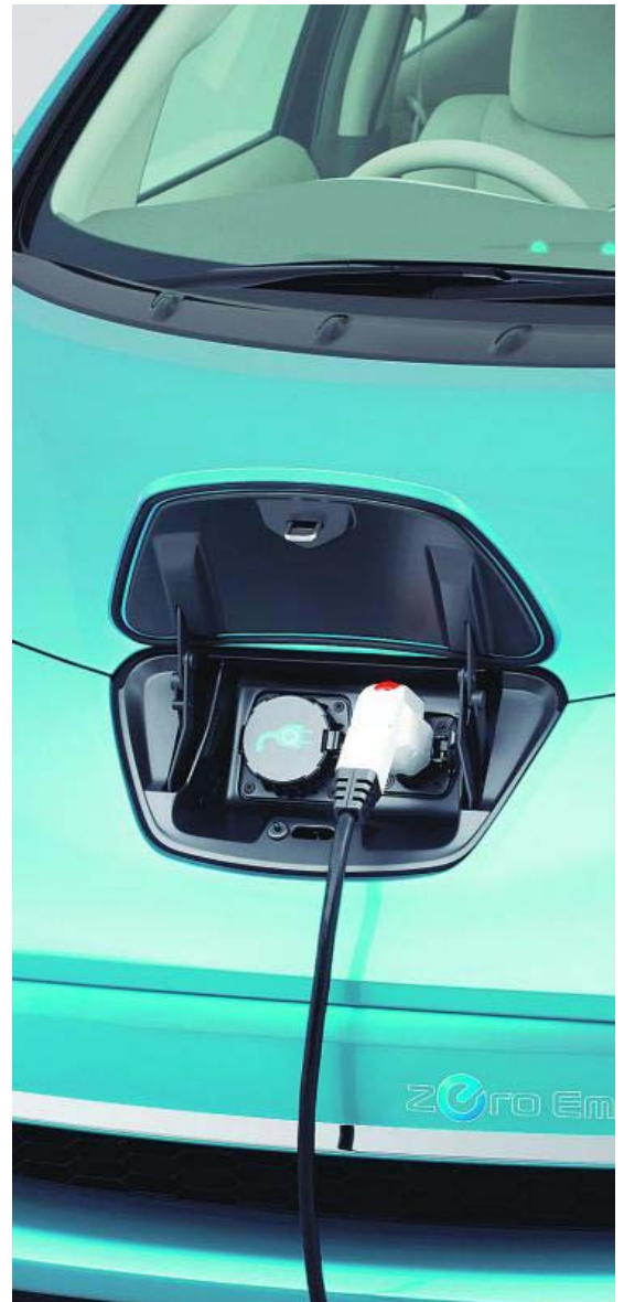
El futuro en ahorro de combustible y respeto al medio ambiente es eléctrico. de