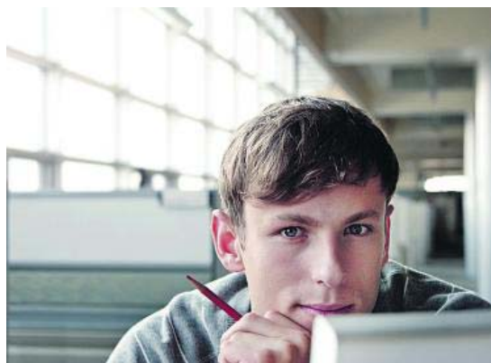
Prácticas, la mejor forma de abrirse camino en el mundo laboral.

El Círculo mantiene este tipo de acuerdos con las facultades de Económicas, Empresariales y de Psicología de la Universidad Autónoma de Madrid (de los que se han beneficiado hasta la fecha más de dos mil estudiantes) y con la Uni-