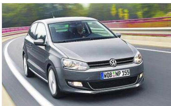
Volkswagen 'Polo', Coche del Año en Europa en el año 2010. elEconomista

GEC ha encontrado en la empresa unos antecedentes nada positivos: la solución de gestión existente era funcional y tecnológicamente obsoleta y se caracterizaba por su falta de interactividad y de flexibilidad. Ante esta situación, la consul-