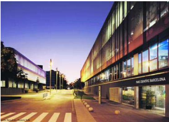
Entrada del edificio Hèlix, que acoge la Bioincubadora PCB-Santander, y Plataforma de Nanotecnología del Parc Científic Barcelona. elEconomista