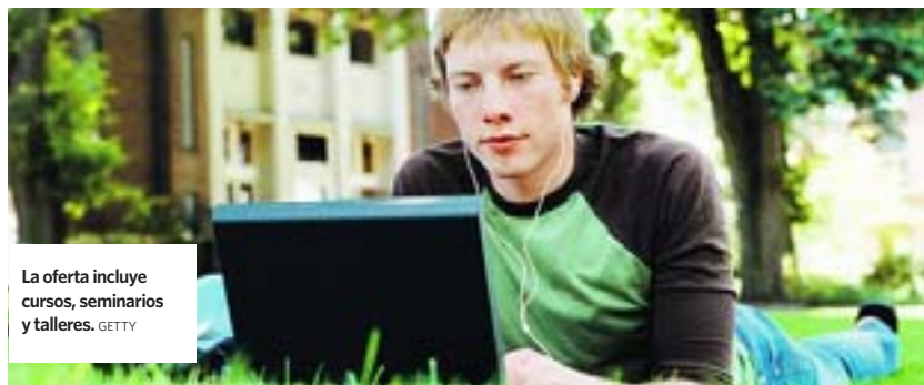
La oferta incluye cursos, seminarios y talleres.

Su temática es de lo más variado, aunque es la actualidad (poli-